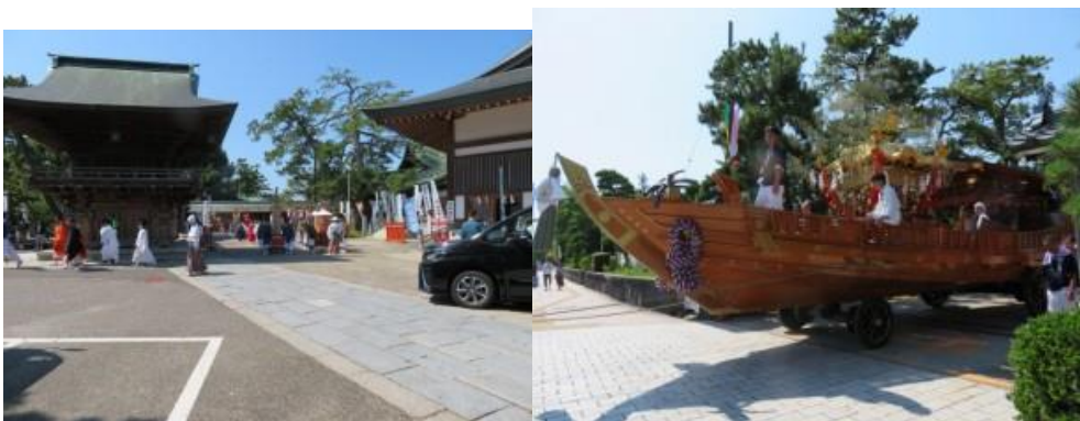
※行列、市内に向い出陣