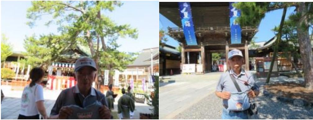
※白山神社を背景にして